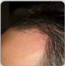
Risultato dopo 10 sedute - Result after 10 sessions