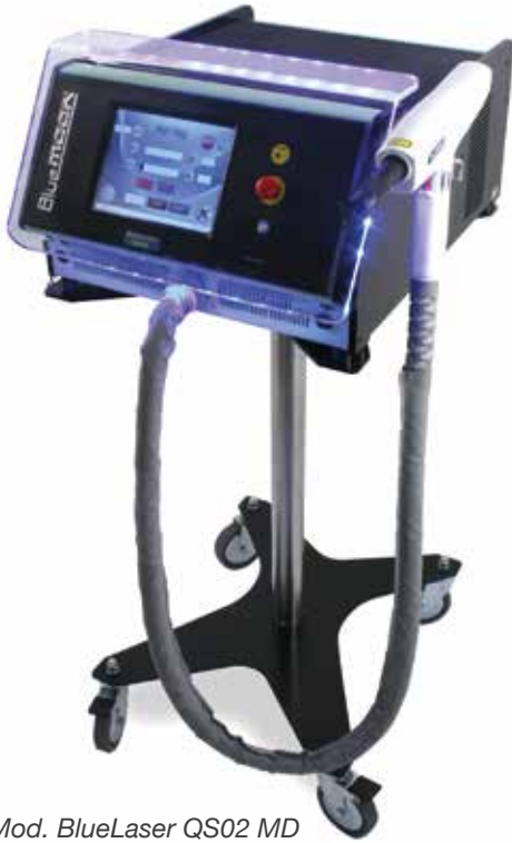
Mod. BlueLaser QS02 MD