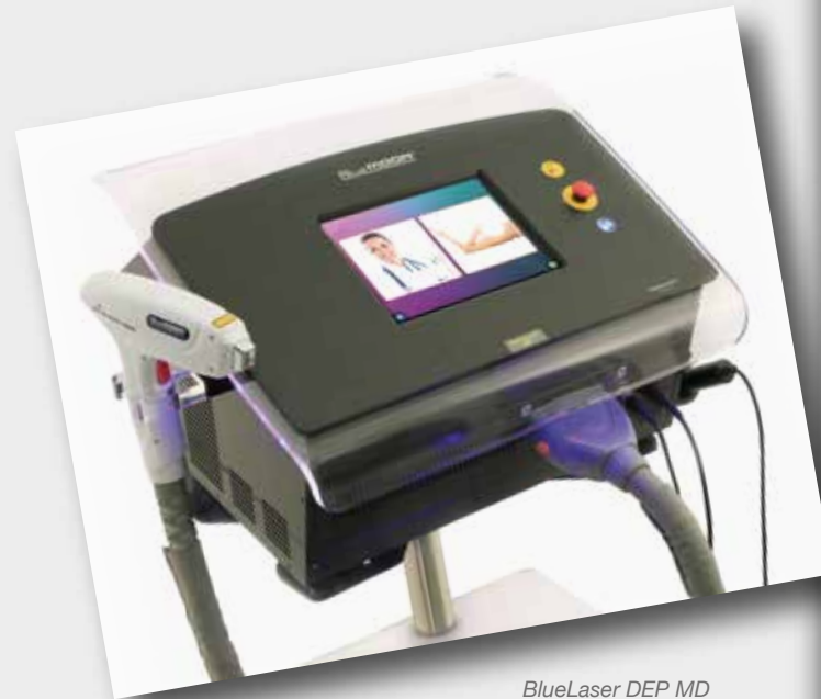
BlueLaser DEP MD